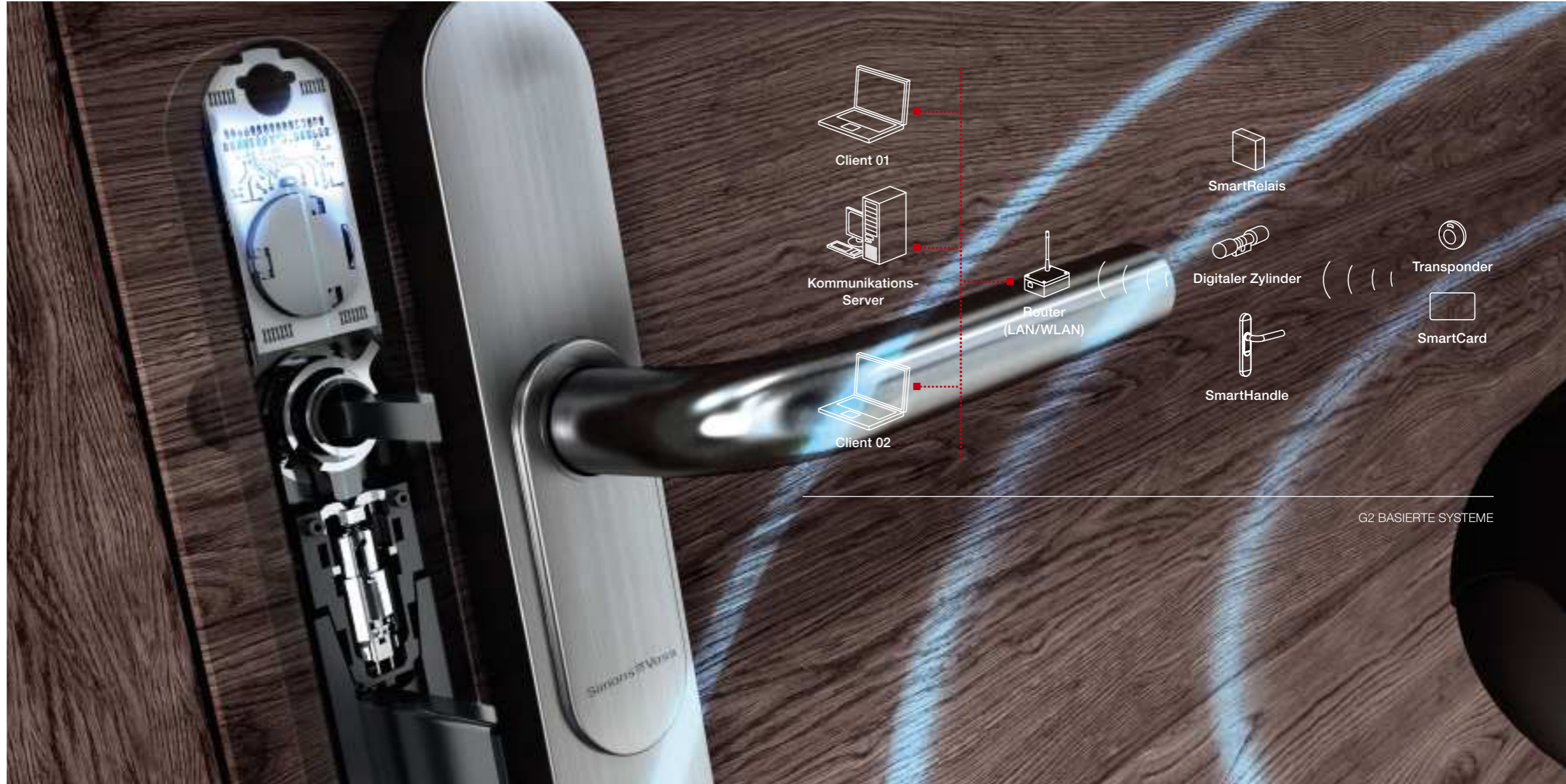
G2 BASIERTE SYSTEME

Elektronische Zutrittskontrollsysteme ersetzen die mechanischen Schlüssel und Schlösser durch ein einfach zu verwaltendes sicheres System, welches die genannten Risiken eliminiert. Schützen Sie unabhängig von der Größe Ihrer Unternehmung Mensch und Vermögenswerte vor Diebstahl und Vandalismus.